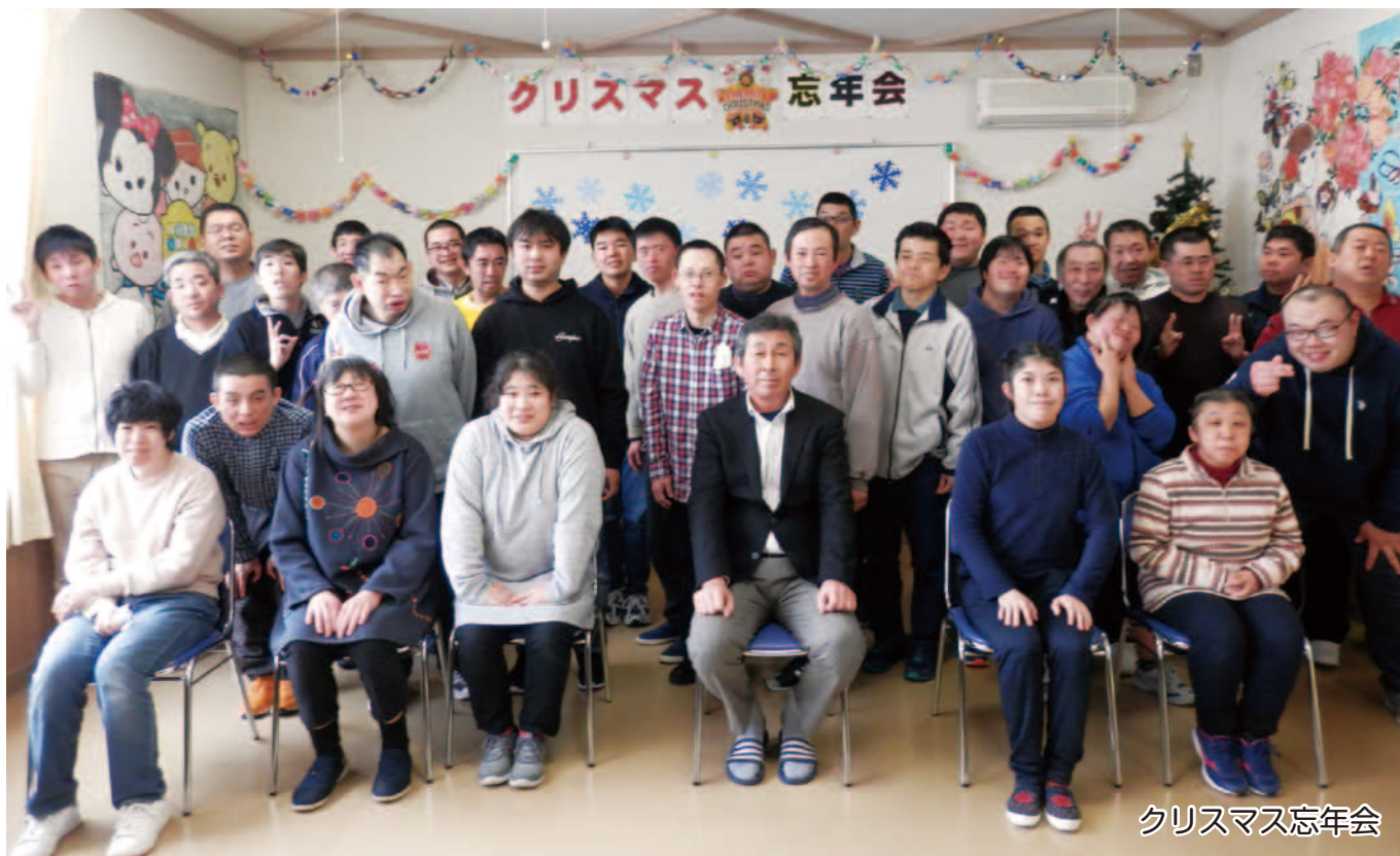
クリスマス忘年会

メールアドレス E-mail matukura@suikokukai.or.jp