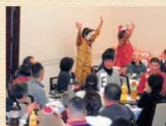
クリスマス忘年会