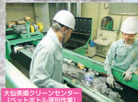
大仙美郷クリーンセンター (ペットボトル選別作業)