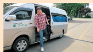
送迎車による登所