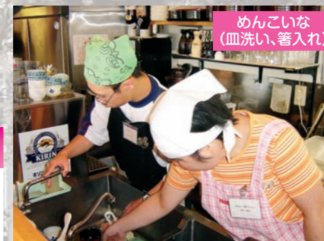
めんこいな (皿洗い、箸入れ)