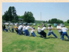
合同レクリエーション