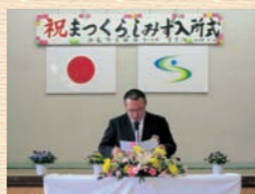
まつくら・しみず入所式

ここに掲載している写真は、年間行事の一部です。他にも色々なレクリエーションを楽しみながら毎日を送っています。日々の活動をブログ形式で「活動報告」に掲載しておりますのでそちらもご覧下さい。