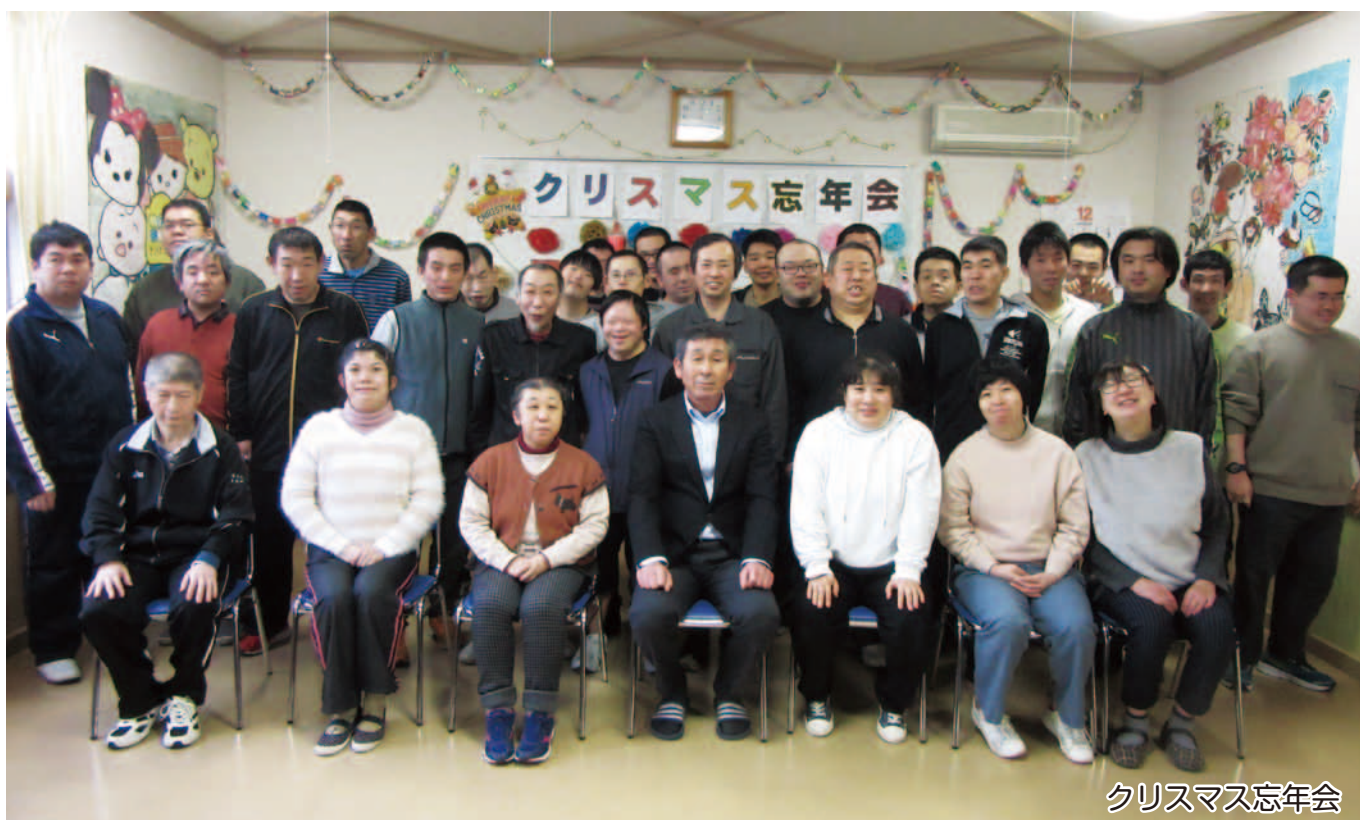
クリスマス忘年会