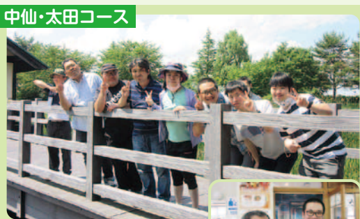
中仙・太田コース