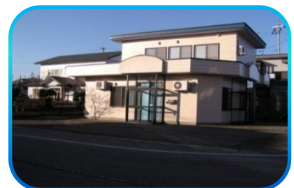
南風寮 (定員4名) 大仙市角間川町字町頭