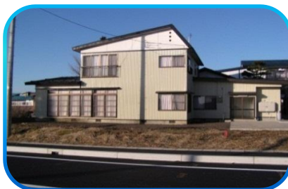
つくし寮 (定員4名) 大仙市藤木字西八圭