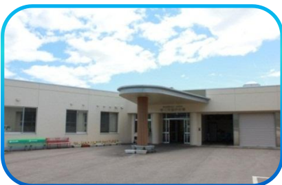
後三年鴻声の里 美郷町飯詰字東西法寺258番地