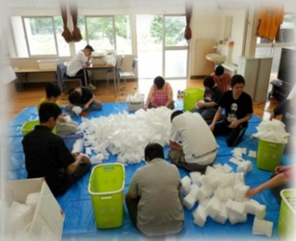
ポリパック結束作業