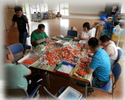
プラスチック選別作業