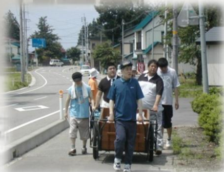
地域活動 松倉地区の古紙回収