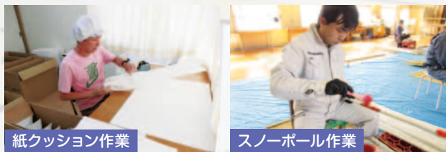
紙クッション作業