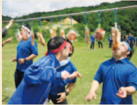
合同レクリエーション