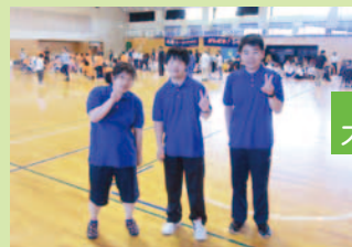
ふれあいスポーツ大会