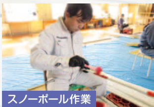
スノーボール作業