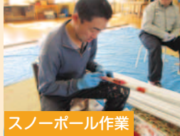
スノーボール作業