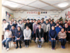
クリスマス忘年会