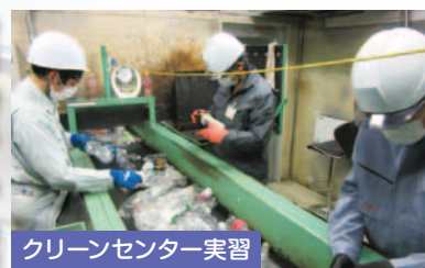
クリーンセンター実習